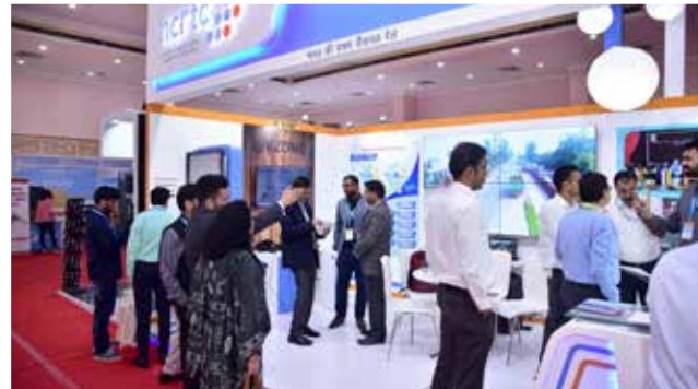
एनसीआरटीसी स्टॉल, 12वां यूएमआई सम्मेलन और एक्सपो 2019