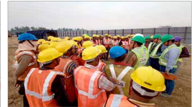
निर्माण के दौरान सड़क सुरक्षा