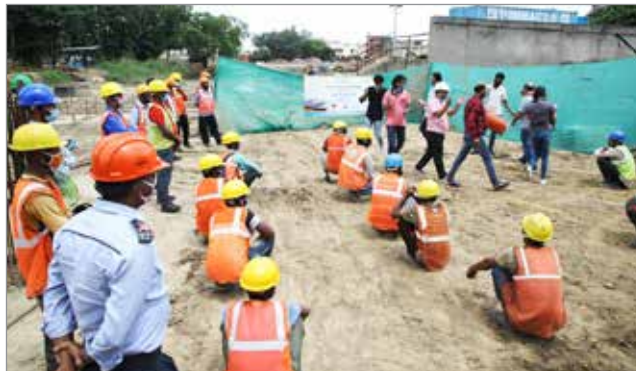
नुक्कड़ नाटक - कोविड जागरूकता अभियान