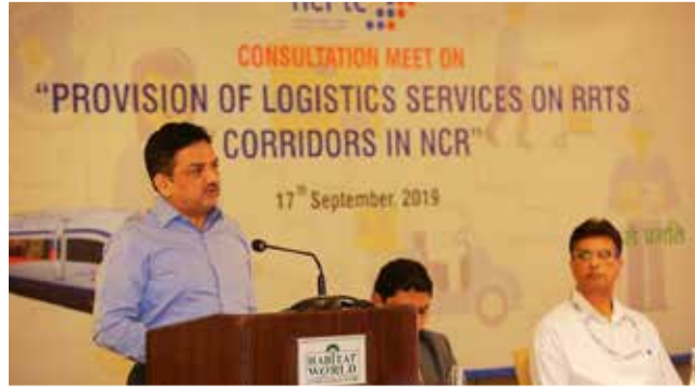
आरआरटीएस कॉरिडोर पर लॉजिस्टिक्स सेवाओं के लिए परामर्श कार्यशाला (17.09.2019)