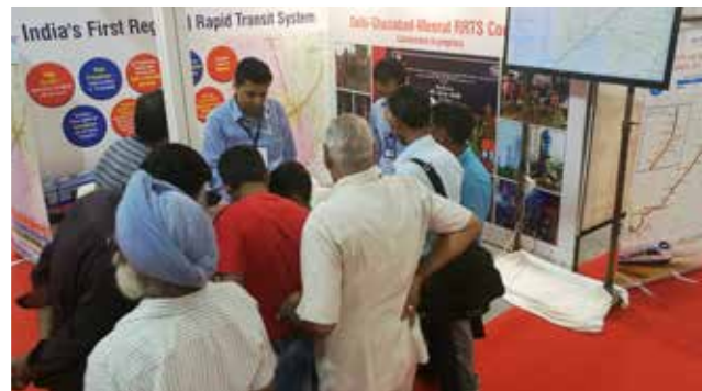
एनसीआरटीसी का स्टॉल, 64वां राष्ट्रीय पुरस्कार और रेलवे प्रदर्शनी, अंबाला (21.07.2019)