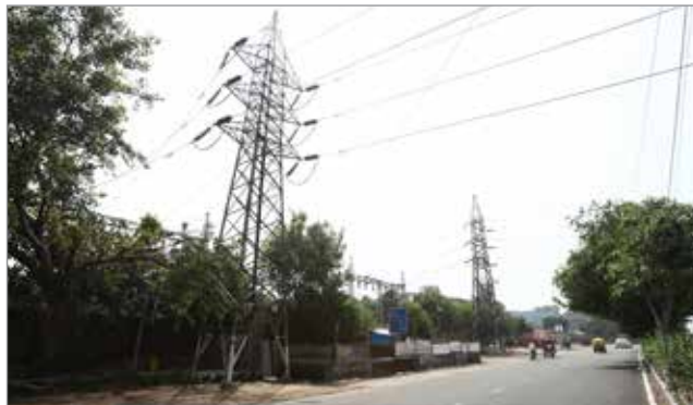
ईएचटी लाइनों का स्थानांतरण और संशोधन