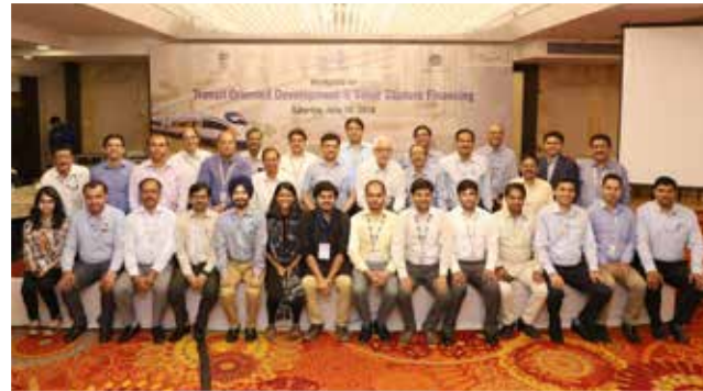
ट्रांजिट ओरिएंटेड डेवलपमेंट एवं वैल्यू केचर फाइनेंसिंग पर कार्यशाला (15.06.2019)