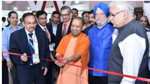
12वें यूएमआई सम्मेलन और एक्सपो 2019 में एनसीआरटीसी स्टॉल का उदघाटन