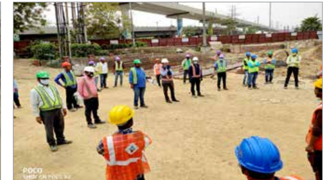
कोविड जागरूकता अभियान