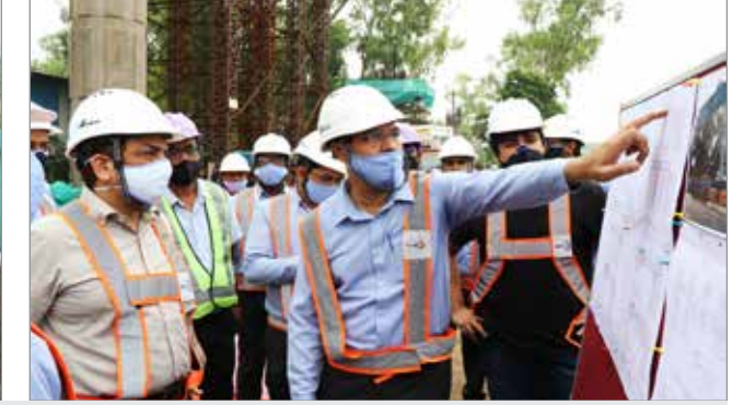
एमडी द्वारा साइट निरीक्षण