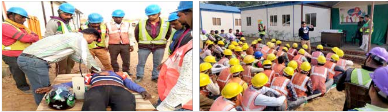
श्रमिक जागरूकता अभियान