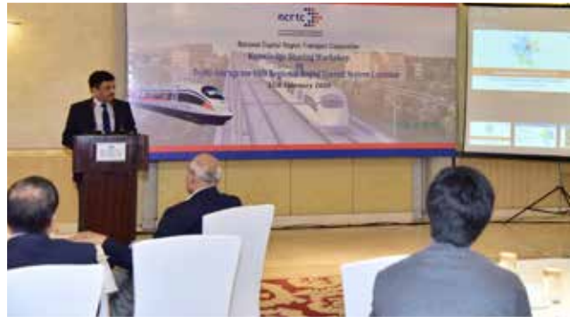
नॉलेज शेयरिंग वर्कशॉप (21.02.2020)